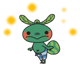
国東市 PR キャラクター