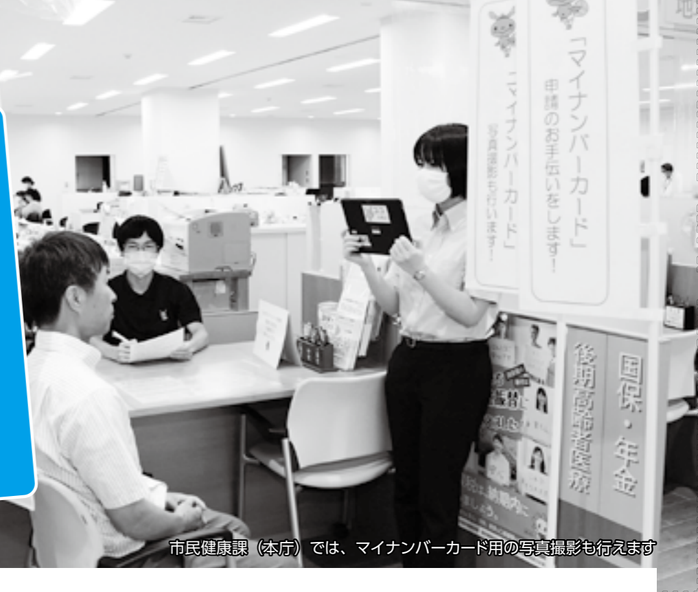
市民健康課(本庁)では、マイナンバーカード用の写真撮影も行えます

市では、マイナンバーカードの取得を推進しています。あると色々便利なマイナンバーカード。この機会に、ぜひ作ってみませんか。