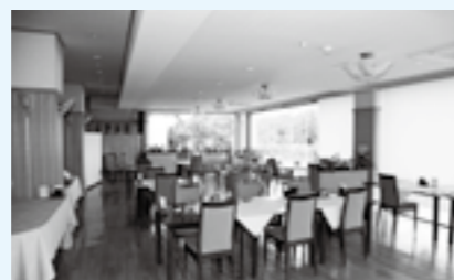
距離が保てるレストラン

主に七島菌を使った履物の製造を行っています。注文が減って先が見えず、私自身も高齢なため、商売の継続について悩んでいました。それでも、従業員から「やれることをして、頑張りましょう」と励まされ、気持ちが奮い立ちました。有難いことに、全国にうちの履物のファンがいらつしゃいます。安心して商品を購入してもらえよう、新たに始めたネット販売事業を大きくしていきたいです。