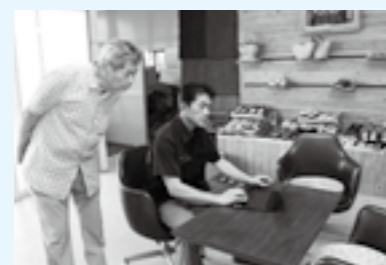
ネット販売に期待がかかる

主に七島菌を使った履物の製造を行っています。注文が減って先が見えず、私自身も高齢なため、商売の継続について悩んでいました。それでも、従業員から「やれることをして、頑張りましょう」と励まされ、気持ちが奮い立ちました。有難いことに、全国にうちの履物のファンがいらつしゃいます。安心して商品を購入してもらえよう、新たに始めたネット販売事業を大きくしていきたいです。