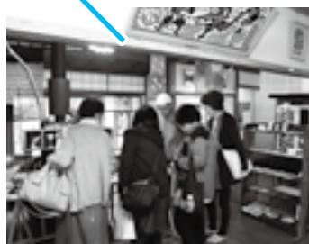
国見ギャラリーめぐり