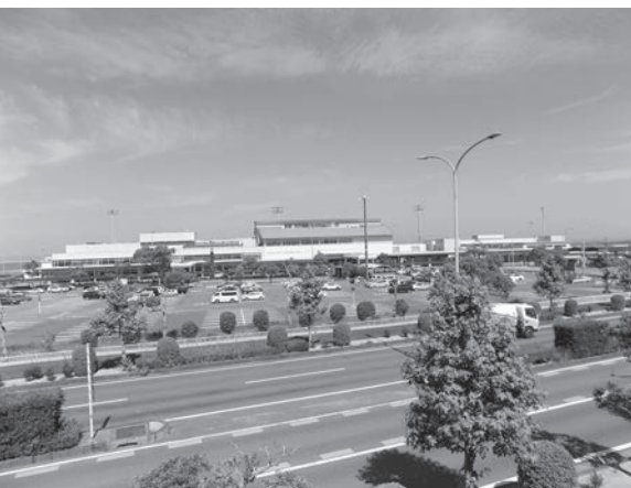
アジア初の宇宙港となる 大分空港

私は国東市が活性化できる大きなチャンスでもあるととらえていますので、大分県と連携し、情報共有を図りながら、市の活性化につながる種々な取り組みを進めていきたいと考えています。