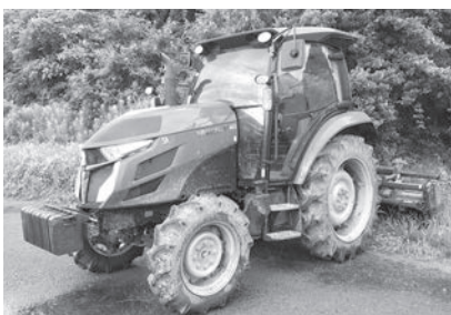
トラクターの運転には作業機幅の確認が必要です