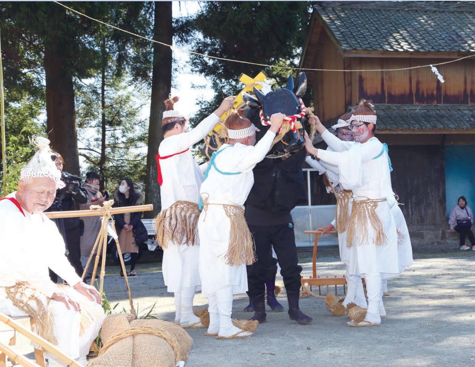
表紙の写真：諸田山神社御田植祭