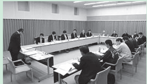
地域公共交通会議の様子