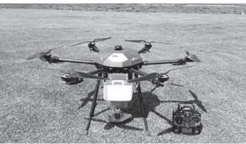
省力化が期待される農業用ドローン

A 経営発展を目指す意欲的な集落営農法人を対象に、農業機械導入に対する支援を目的とした事業です。今回、農業用ドローンを導入することにより、水稲・麦防除の省力化・効率化を図り、経営規模拡大に繋げていく予定です。