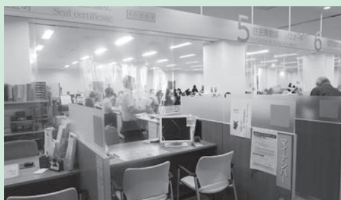
マイナンバーカードを発行する 市民健康課の窓口

住民基本台帳法施行令の一部改正に伴い、旧氏での印鑑登録を可能とするための規定を整備するとともに、性的少数者に配慮して印鑑登録原票及び印鑑登録証明書の性別表記の廃止等を行うにあたり、本条例の一部を改正するもの。