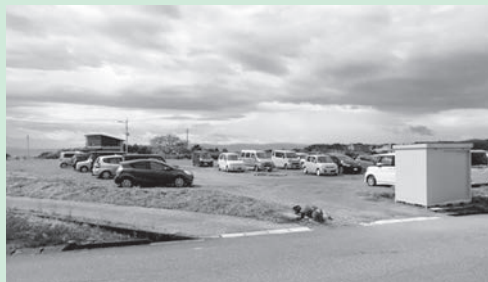
安岐町下原の分譲地整備予定地

国東市が行う宅地造成について、委員外議員から広さ約9,000㎡の事業計画について質問があり、まちづくり推進課長から、これからプロポーザル方式で入札業者を決めるため、事業の計画等について今後決定していくことになりますと回答がありました。