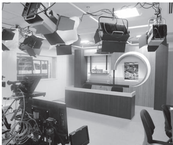
市役所3階のケーブルテレビスタジオ

小中学校が長期間休校となった場合、ケーブルテレビによる自主学習用のテレビ放送ができないか。