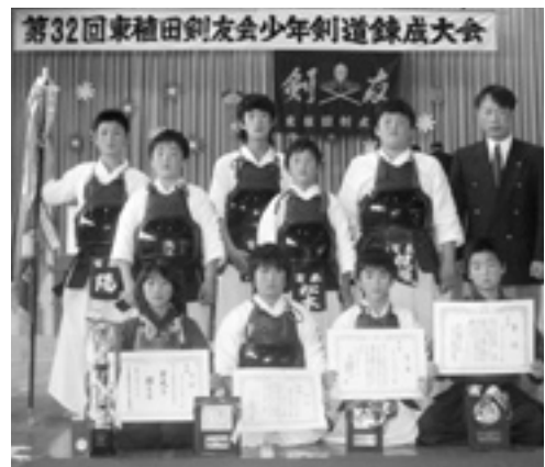
▲優勝した富来少年剣道クラブの皆さん