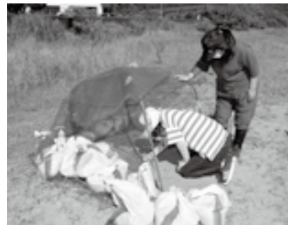
市内で2年ぶりに確認された、海がめの産卵。ふ化まで、毎日見守り活動を行っています。

活動で最も重視していることは、国東市の将来を担う、子どもたちへの教育です。地元で「海がめが産卵に来るきれいな海岸がある」ということを、もっと子どもたちに知ってもらい、誇りを持ってもらいたいですね。活動を通じて、この国東の美しい海岸を守り、次の世代に引き継いでいきたいと思っています。