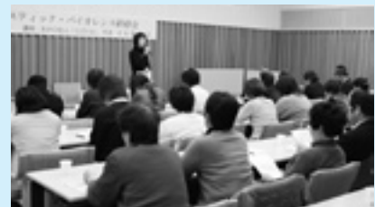
▲アストくにさき会議室で行われた研修会には55人が参加

今回は、 第4回 基本目標 Ⅲ 男女が安心して暮らせる環境づくり のお知らせをします。 計画書をご覧になりたい方は、企画課男女共同参画係までご連絡ください。 ☎0978-72-5161