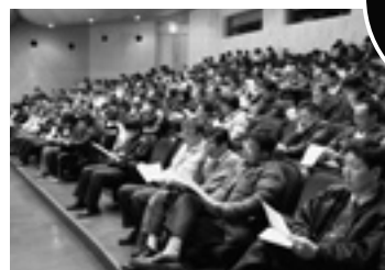
▲3月6日木の職員研修のようす