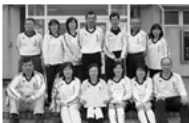
▲年齢制限の部・Aパート優勝の「上国崎」の皆さん ②「旭日」