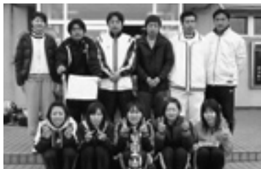
▲フリーの部・Aパート優勝の「混成カモメ」の皆さん ②ワンピース