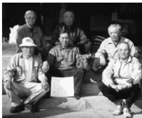
▲優勝した「富来」の皆さん ②「鬼籠」 ③「恒清」「下馬場」