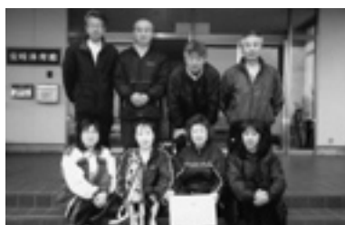
▲年齢制限の部・Bパート優勝の「田深」の皆さん ②ドリムAKI