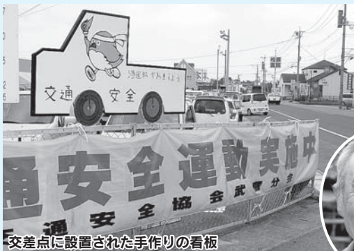
交差点に設置された手作りの看板