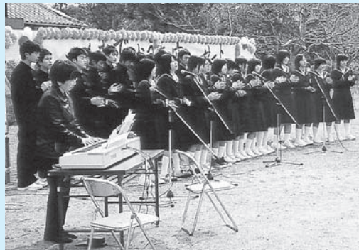
▲「ふるさと」を手話を交えて歌う 八幡浜市立八代中学校の皆さん