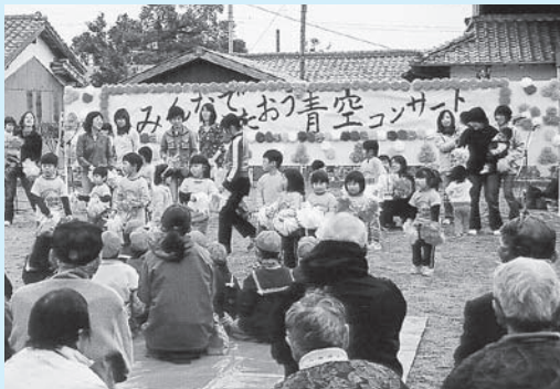
▲元気よくめじろんダンスを踊る 「マザーズドリームタッグ」の皆さん

また、まちおこしグループの皆さんによる「おにぎり」や「豚汁」の炊き出し、子ども茶道教室の皆さんによる野点、入所者絵手紙クラブの作品の展示も行われ、約150人の参加者と入所者がふれあいました。