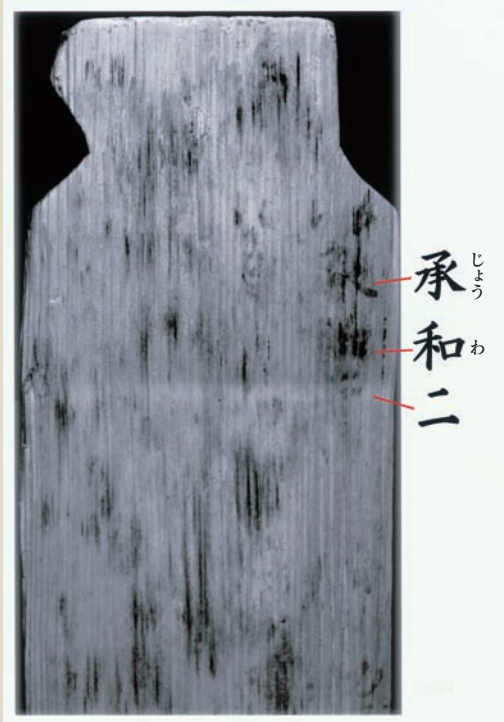
※倉札 荘園主が、日々の収納米の収量を記し 荘園の管理や経営に利用した札のこと