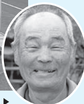
中国 信人さん ▶