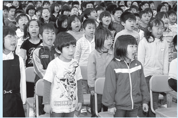
▲やさしいことばと歌で新入生を迎える在校生の皆さん