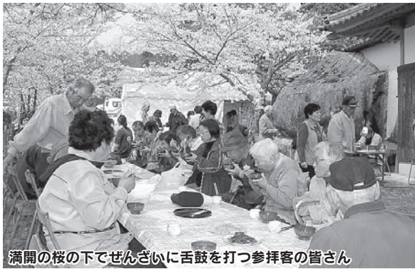
満開の桜の下でぜんざいに舌鼓を打つ参拝客の皆さん

サッカー人口の拡大と競技力の向上を目的とした「みんなんサッカー交流大会」(主催 NPO 法人 923 みんなんクラブ)が、3月29日(土)・30日(日)の2日間、国見陸上競技場、くのみ海浜公園で開催されました。今回で2回目となった大会には市内をはじめ北九州市、大分市から32チーム、約600人の選手が参加して、交流を深めました。