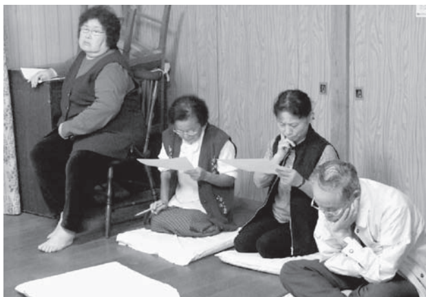
とある会場での学習会の様子(昨年)