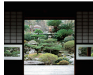
明治初期に建てられた邸跡は庭園も見事

〒国東市国見町岐部536 ☎0978-83-0321 9:00～17:00 休水曜日(祝日の場合は翌日)、12/29～1/3 大人200円 ※団体割引(15名以上150円)、中学生以下無料