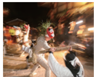
隔年で旧正月5日に開催される『修正鬼会』