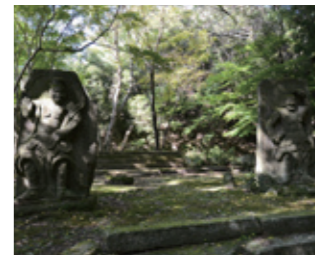
旧千燈寺の本堂跡にたずむ半肉彫りの仁王像