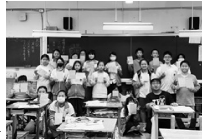
「手紙届いたよ、ありがとう」 百齡高校附属中学校・日本語クラブ

この事業は、台湾新北市教育局をはじめ、多くの関係団体のご協力をいただいています。今後は教育・文化の分野にとどまらず、産業や観光などの分野にも広がることを期待しています。