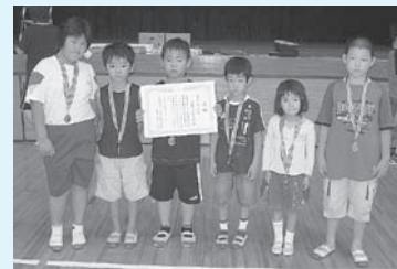
▲低学年の部の志和利・上糸原・成吉・今市合同チーム