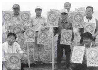
▲作業終了後、商工会の皆さんが、「犬のフンを捨てないで」と手作り看板を地区内に設置し、犬の飼い主に注意を呼びかけました。

きれいな羽田海岸を守ろうと、6月29日(日)午前8時から、国東町商工会富来支部の皆さんをはじめ、柳、浦手区、同区の老人クラブ、富来ようなれ会、富来中学校の全校生徒約100人が参加して、約2時間かけて草刈りや空き缶等のごみ収集を行いました。