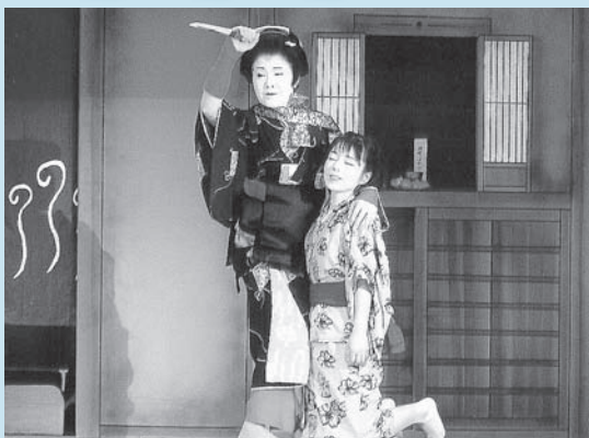
■「英彦山権現誓助太刀六助住家の段」