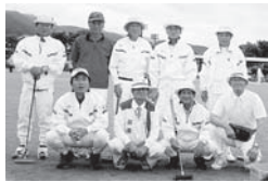
ゲートボール男子