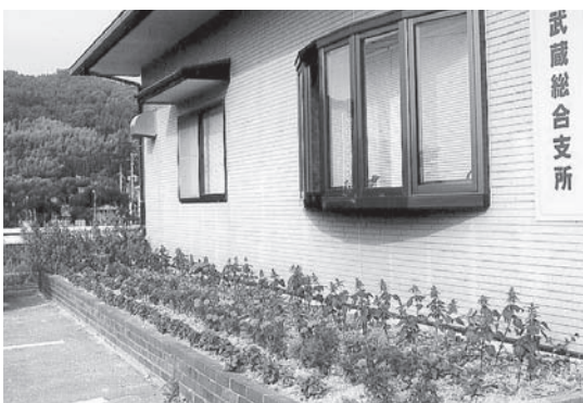
▲武蔵出張所の花壇

から一つの笑顔が生まれ、やが て二つになり三つに……そし てさらに増えることでしょう。 武蔵出張所に笑顔の花が咲きま した。私にも幸せを届けてくれ ていきます。さあ、今日も水やりを しよう。