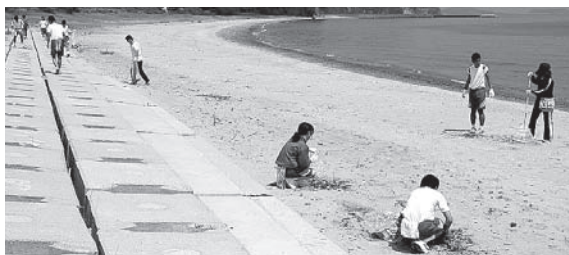
▲来浦中学校の皆さん

また、来浦中学校の全校生徒20人と職員10人で、夏休みを前に7月18日(金)、来浦海岸の清掃作業を行い、ゴミや空き缶、ペットボトル等を収集しました。