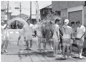
▶水掛まつり 7月27日(日) 武蔵町 古市