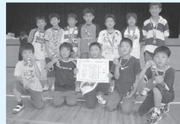
▲高学年優勝の小城・向陽台・南糸原・内田・上糸原・今市合同チームA