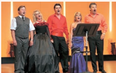
▲最後にソリスト全員でスロバキア民謡を披露しました