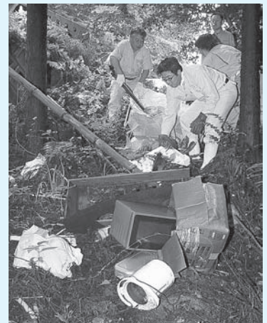
▲不法投棄物を撤去する青年部の皆さん

その後、参加した16人の青年部の皆さんは、国東町来浦の不法投棄されている場所へ移動。2カ所に分かれて作業を行い、約2時間で770kgのごみを撤去しました。