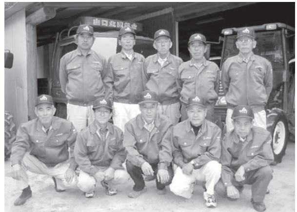
▲山口生産組合の皆さん