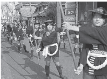
▶田深天満社お練り 7月25日(金) 国東町 田深天満社