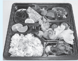
◀「国東ゆめ弁当」は、全校生徒から募集して名前が付けられました

国東特産の太刀魚・わかめ、国東高校産ハウスみかんや郷土料理の「おらんだ」など入った弁当は、1個400円で販売され、たいへん好評でした。