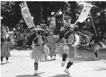
◀吉弘楽 7月27日(日) 武蔵町 楽庭八幡社