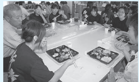
▲試食する野田市長と家庭クラブ員