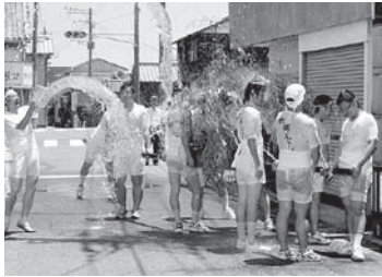
▶水掛まつり 7月27日(日) 武蔵町 古市