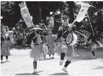
◀吉弘楽 7月27日(日) 武蔵町 楽庭八幡社