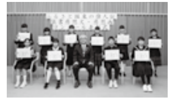
2月24日にアストくにさきで表彰式が行われました。