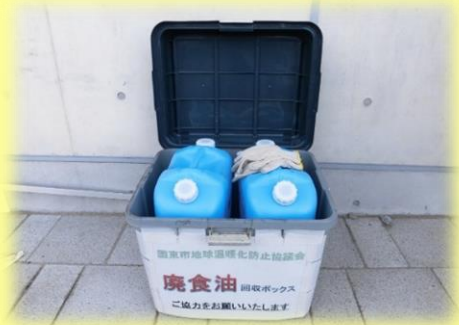
廃食用油回収ボックス

家庭から出た食用油を 燃料 として再資源化！排出量を減らし、有効活用につなげよう！市役所・総合支所に回収ボックスを設置しています。