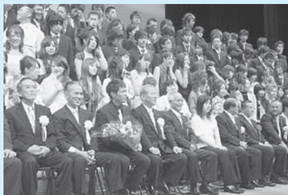
▲式典終了後、記念撮影を行いました