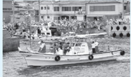
▲祝島の皆さんをはじめ多くの人々に見送られ出航する御座船

20日には、伊美港から日帰り観光フェリーで約200人が祝島を訪れ、大漁旗で飾り付けられた權伝馬船や漁船が御座船(ござぶね)を見送る出船神事を見学しました。