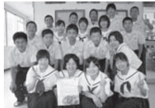
◀サンタクロースからの手紙に喜ぶ来浦中学生の皆さん