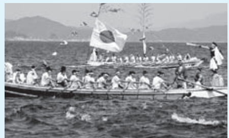
▲御座船を見送る権伝馬船