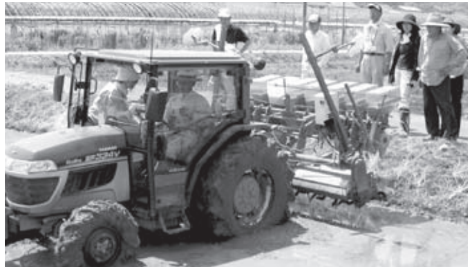
▲低コストを目指して、水稻直播栽培に挑戦!