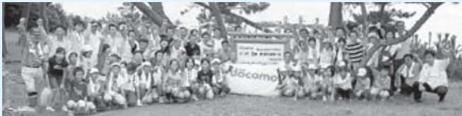
▲自然を大切にすぞ!

同社では、全国に39カ所にドコモの森を開設して自然環境保護活動を推進しており、今回で40カ所目、九州では6番目の開設となりました。