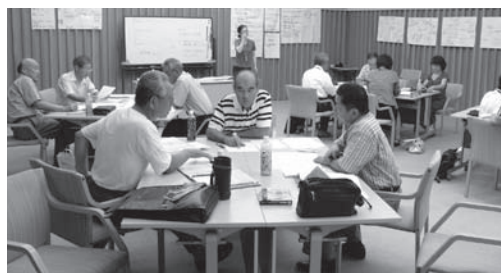
▲講座を受講する皆さん