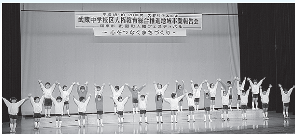
▲むさしこども園・武溪保育所合同の歌と手話