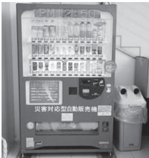
▲アストくにさきに設置された自動販売機