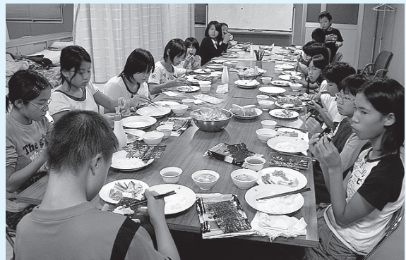
▲支援委員会や地域のボランティアの皆さんの指導を受けながら、全員で協力して炊事などに取り組みました

子ども達が公民館に泊まって共同生活しながら学校に通う「通学合宿」には、武蔵町内の小学4・5・6年生19人が参加。日ごろ体験できにくい異年齢の仲間たちと通学合宿を通して自主性や協調性を培い、子ども達の生きる力を養うとともに、家庭や地域社会の大切さを学ぶことを目的に、武蔵町では平成13年から毎年実施しています。