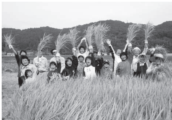
▲上国崎小児童との水稻収穫体験

異常気象で安定した作柄が望めないことや、米・麦・大豆の単価が不安定なこと、また、補助金政策がいつまで続くかわからず不安を感じている。今後は、高収益作物の積極的な導入を図りたい。そして、農業収支のみで経営が成り立つように経営努力をして、後継者を確保したい。