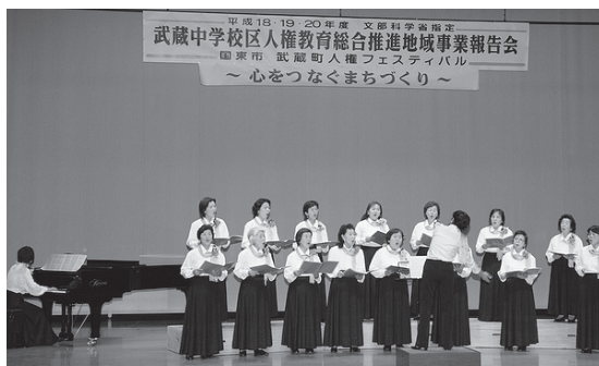
▲コーロ・アザレアの合唱

今年の国東市武蔵町人権フェスティバルは、文部科学省指定武蔵中学校区人権教育総合推進地域事業報告会の一環として、例年より約一カ月早く11月7日(金)に武蔵セントラルホールで開催され、およそ450人が参加しました。 平成18年度から3年間の取り組みの様子や成果が発表され、集まった多くの関係者が関心を寄せていました。 また、各小中学校代表者による人権作文発表では、子どもの視点から、なかまや自分をするどく見つめた意見が聞かれたり、学習発表では、かわいい園児たちの歌う姿に、会場内には明るい笑顔が満ちていました。