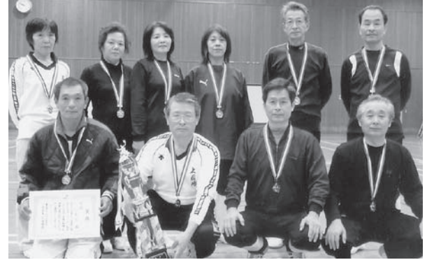
▲ミニバレーボール競技で優勝した国東町チームの皆さん

国東市からは、ゲートボールや野球、囲碁、ミニバレーボールなど7種目に91人が参加し、各種目で熱戦を繰り広げ、ミニバレーボール（国東町）が優勝、還暦軟式野球（国見町）が3位に輝きました。