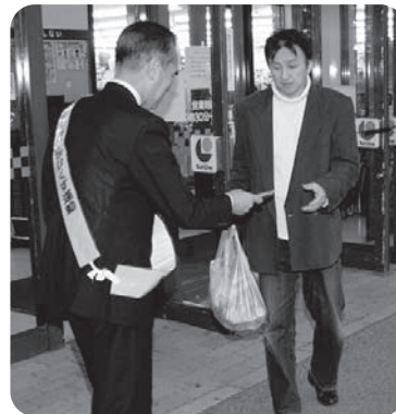
キャンペーンの様子