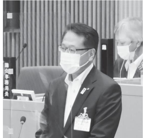
所信表明する河野盛次 新教育長