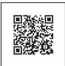
QRコード 国東市避難所一覧

個別避難計画があります。今後、多職種の方による計画策定、実際の避難についての検討をしていきたいと考えております。