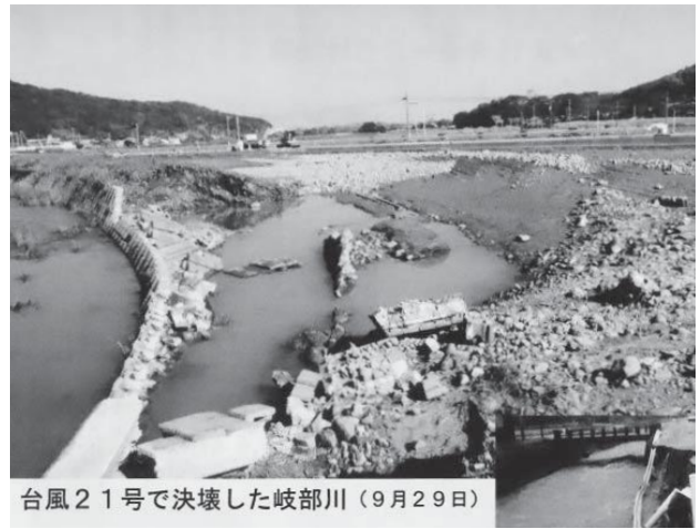
台風21号で決壊した岐部川(9月29日)