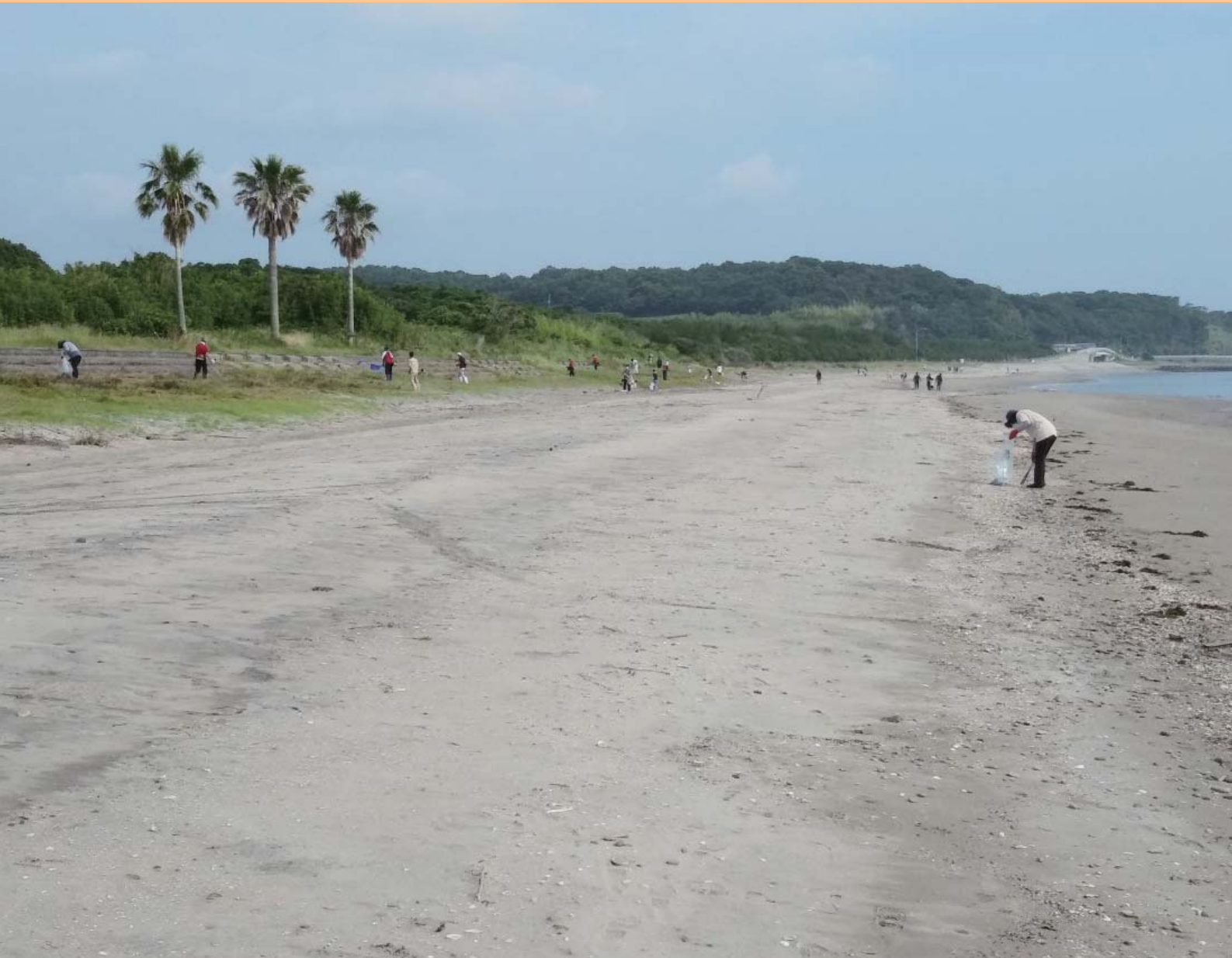
表紙の写真：羽田海岸のボランティア清掃