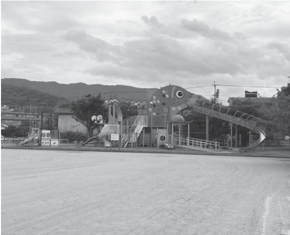
安岐コミュニティ広場