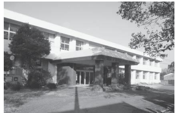
企業に無償貸付される旧武蔵東小学校