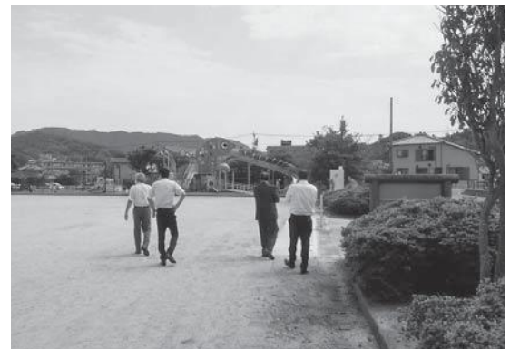
安岐コミュニティ広場・たいたい公園を視察する文教厚生常任委員会のメンバー

また、請願第1号の採択にあたっては、速やかに地元住民や関係者と協議し、より素晴らしい公園整備に努めて頂くことを求めました。