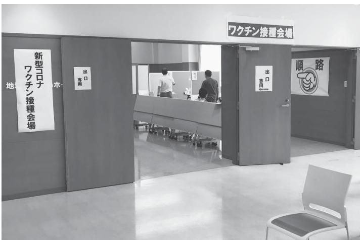
国東市民病院のワクチン接種会場

また、市の薬剤師会のご協力で、病院の薬剤師の業務負担軽減に、市の職員の受付業務・事務部門での協力で、病院職員の休日勤務者を減らすことにつながっています。