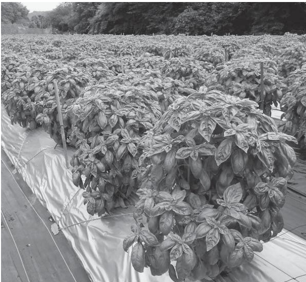
国東市内のバジル圃場

また、この圃場を活用して、新規に導入される農業者の研修も実施したいと考えております。