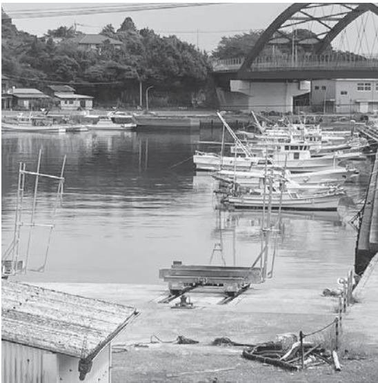
市内の漁港の様子

A コロナ禍の影響が長期化する中、水産業においては、いまだに取引量や魚価の低迷が続いており、漁業を主たる生計としている漁協正組合員の事業収入の減少は顕著であるため、支援の必要性があると判断し、昨年と同様に正組合員に対する給付金、支援とした次第です。