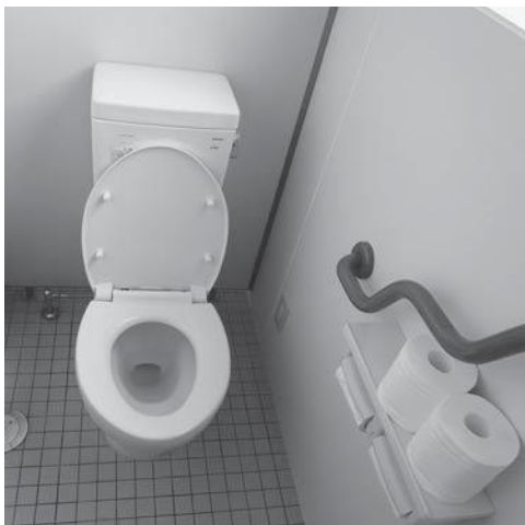
バリアフリー化されたトイレ

行政区で管理運営されている自治公民館のトイレ等の修繕工事については、国東市自治公民館建設等補助金交付要綱に基づき、事業費に応じた補助金(45%)を交付しています。