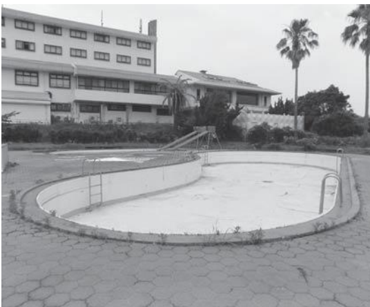
令和3年度予算で全面改修される 「ホテルベイグランド国東」敷地内のプール

県下14市の中で、危機管理室が設 置されていないのは本市を含めて2 市ですが職員数等他市と比べても劣 るものではなく、現状の体制で十分 対応出来ると考えています。