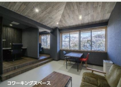
コワーキングスペース