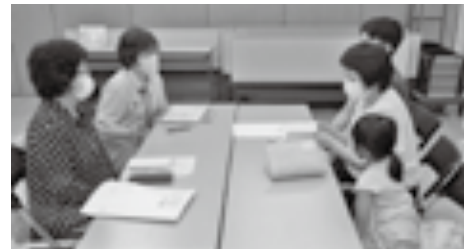
援助活動の前に必ずコーディネーターを交えて両会員の顔合わせを行います。