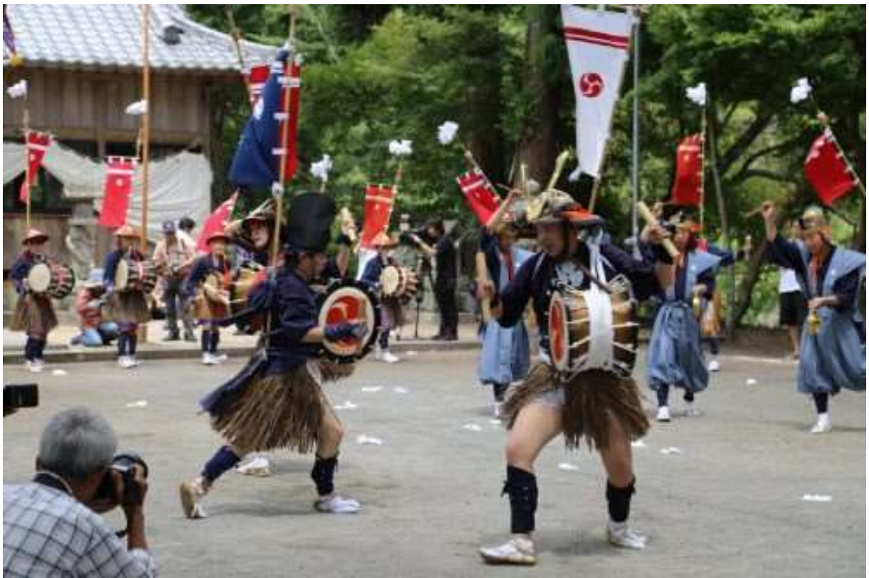
吉弘楽 (楽庭八幡社 武蔵町)