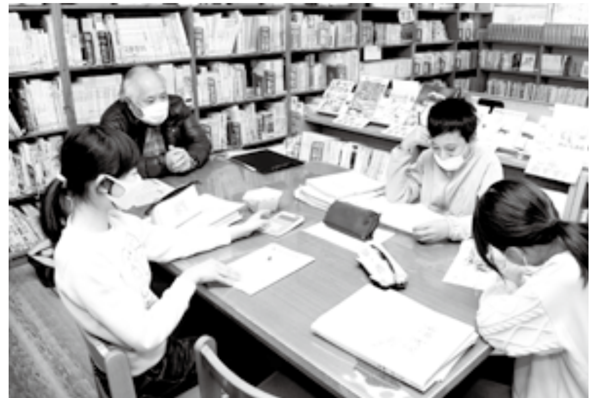
「学びの教室」(旭日小学校)