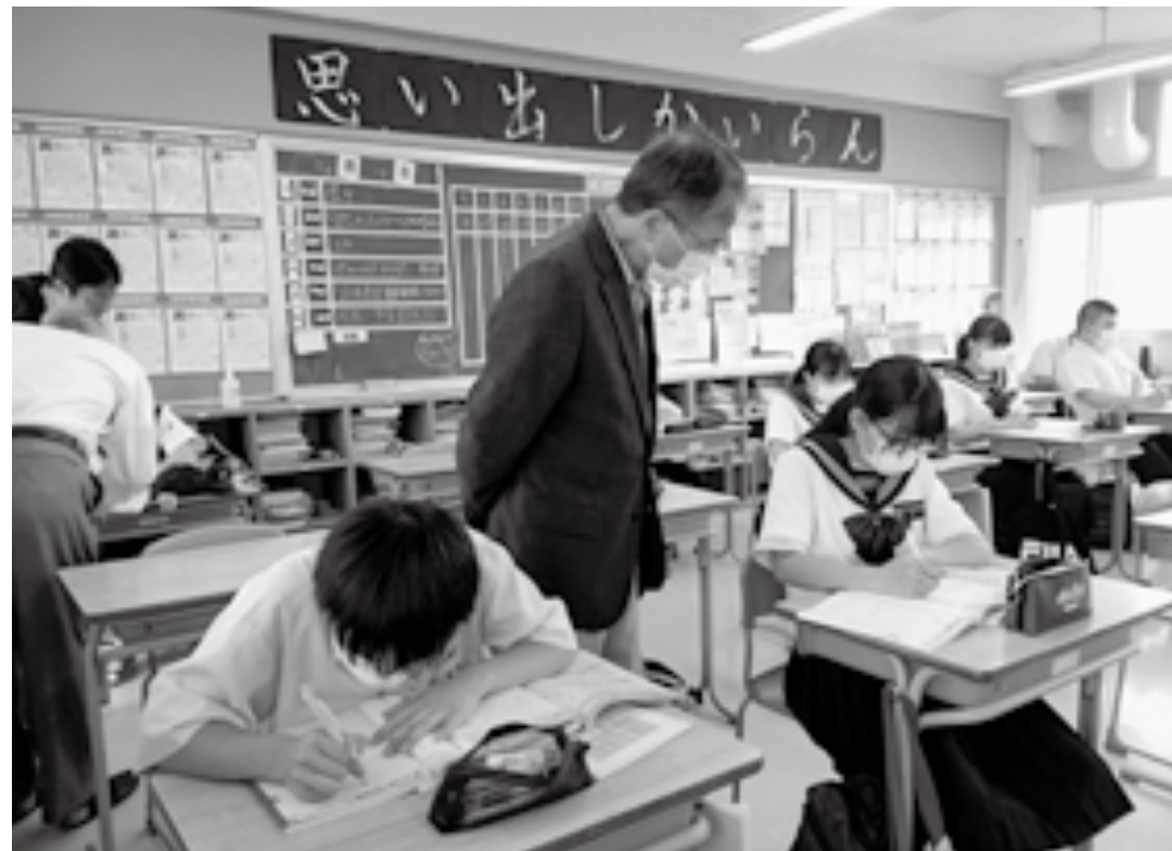
「学び塾」(国東中学校)

2年生のときから学 びの教室に来ています。 算数と理科が好きです。 「学びの教室」では、先生 (アドバイザー)が優しく 教えてくれるので、算数 と理科がどんどんできる よつになりました。 「学びの教室」に行くの が、とても楽しいです。こ れからもずっと続けてい きたいです。