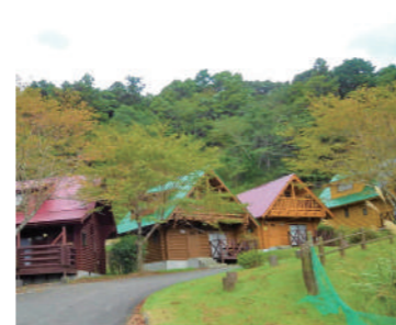
ロッジ ベッドと宿泊可の棟を3棟設けたキッチン、バス、トイレ完備のロッジ。