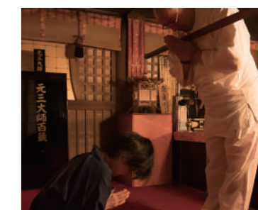
坐禅 呼吸を整え身体を正し自らと向き合う