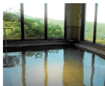
梅の湯 日帰りでも利用できる大浴場。ジェットバスやサウナも完備。