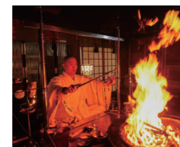
護摩祈禱 厄よけや合格祈願を燃え上がる火の前に行う

煩惱を焼き尽くす護摩は大切な行事の一つ。それを間近で見られるのも文殊仙寺ならではの。また、坐禅や写経といった体験も行っている。※状況により体験できない場合があります。体験の可否に関しては事前にお問い合わせください。