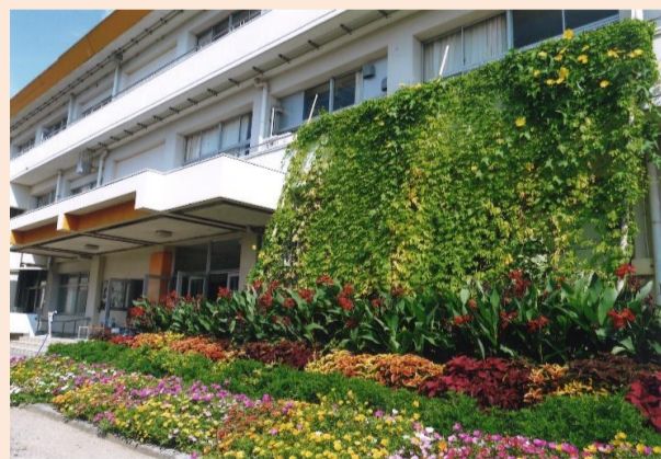
令和3年度 最優秀賞 国東小学校 様