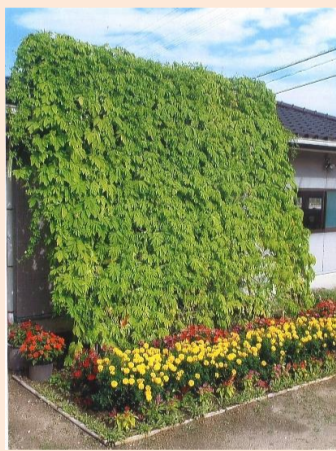
令和3年度 家庭部門賞 糸永 光 様