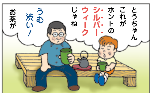
※5月の連休はゴールデンウィーク、9月の連休をシルバーウィークといいます。