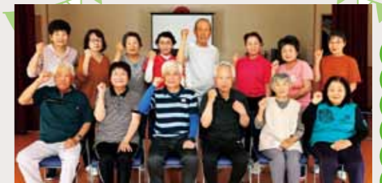
西本わかな会の皆さん (安岐町西本)