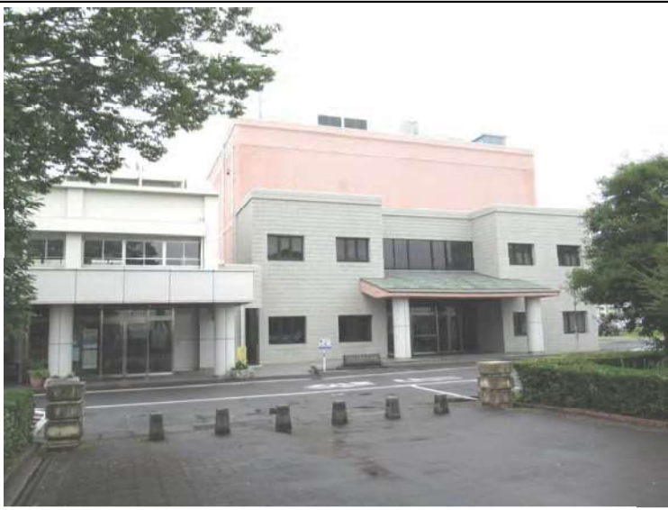
武蔵中央公民館とセントラルホール