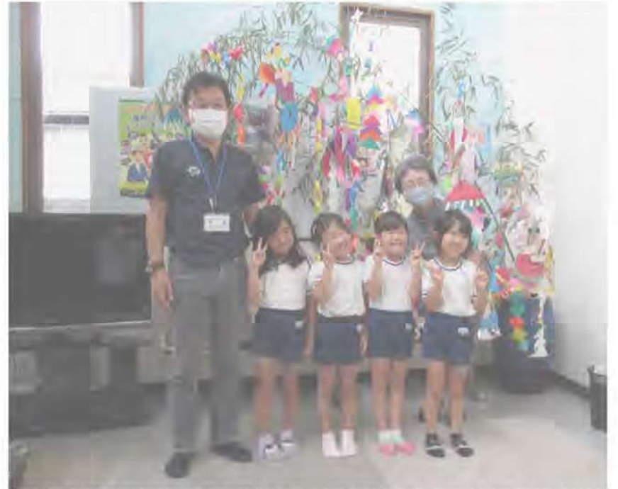
七夕飾り 武蔵保育所の園児からの七夕飾りが7月3日（金）、西地区公民館に届きました。願いが叶いますように！