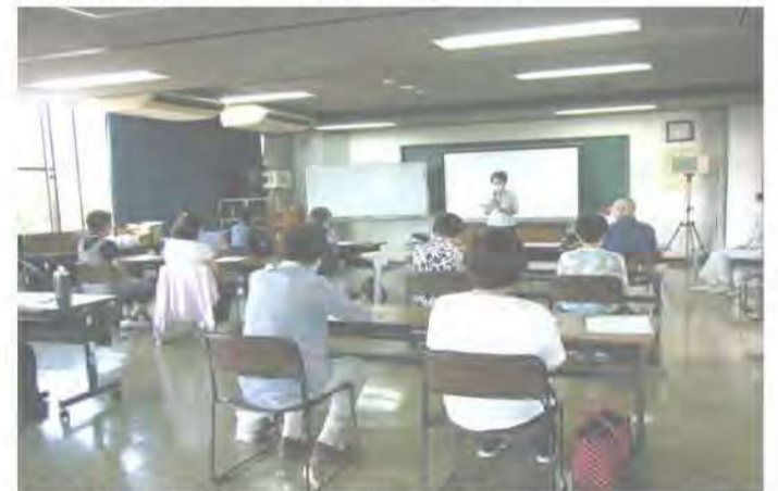
6月23日（火）第1回食の恵み教室の学習風景