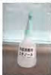
手指消毒用エタノールによる手指の消毒（利用前）

6月1日（月）より各地区館の教室や講座を再開しました。感染対策として利用人数の制限、利用時間3時間程度、利用後の備品の消毒など細かい条件がありますが、ご理解ご協力のほどよろしくお願いいたします。