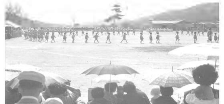
昭和30年代後半の西小学校の運動会の風景