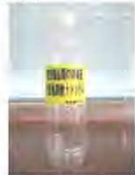
次亜塩素酸ナトリウムによる備品の消毒（利用後）