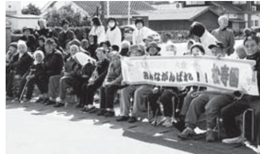
▲手作りの横断幕を手に、応援する老人ホーム松寿園(国東町富来浦)の皆さん