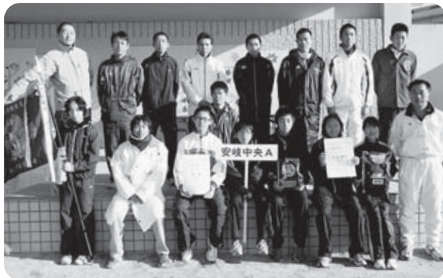
▲優勝した安岐中央Aの皆さん