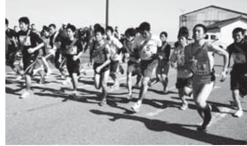
▲富来開運橋の再スタートの様子