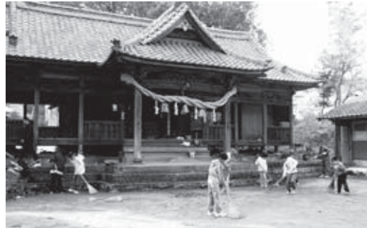
▲諸田山神社の清掃活動を行う朝来文化財愛護少年団