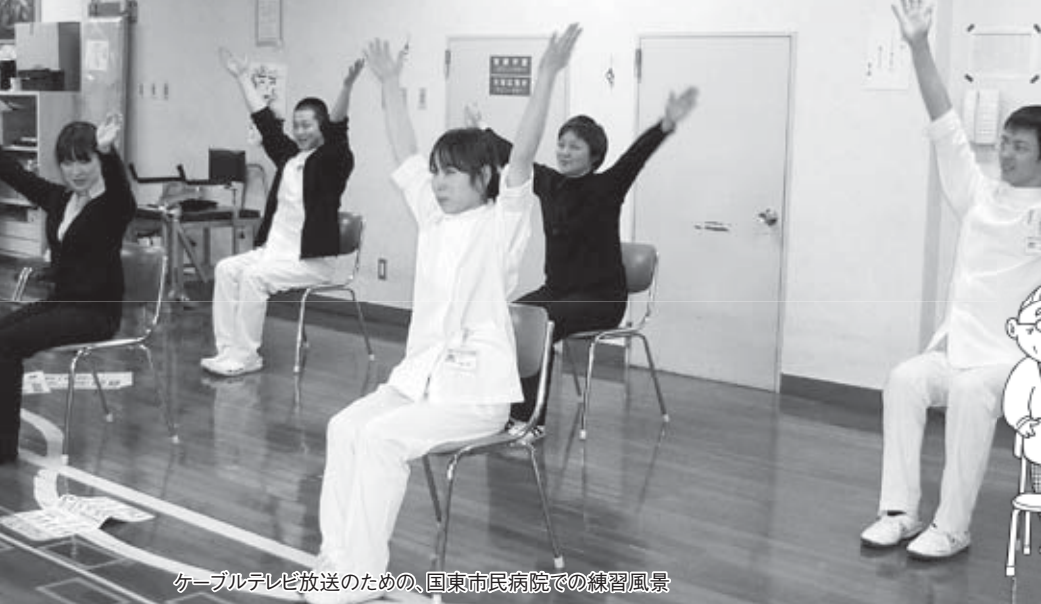
ケーブルテレビ放送のための、国東市民病院での練習風景