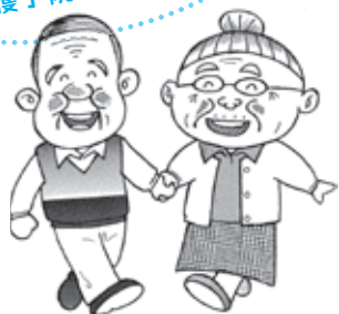
いきいきじいちゃん ちよるちよるばあちゃん