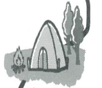
ばいえん さと 梅園の里 キャンプ場