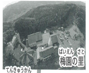
てんきゅうかん ●天球館

ばいえん さと えいぎょうじかん 梅園の里 営業時間 11:00~22:00 でんわ かよび きゅうぎょう 電話 0978-64-6300 【火曜日は休業】