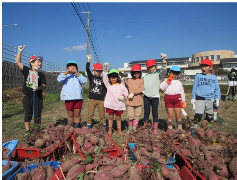
たくさん掘れたよ〜！！ 大収穫でした！！