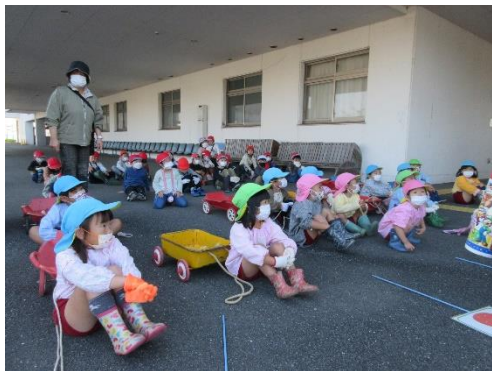
いもほりの話を聞いて

どんなお芋が掘れるのかなとワクワクドキドキで待っていた子どもたち。土が少しかたいようでしたが、友だちや一年生と力を合わせて夢中になって掘り進めていきました。傷がつかないように大切に丁寧に掘り出し、「大きなお芋が掘れた！」「たくさんつながってる！」「重たい！」と子どもたちは大喜びでした。