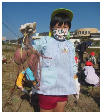
大きなお芋が つながってる！ 兄弟みたい。