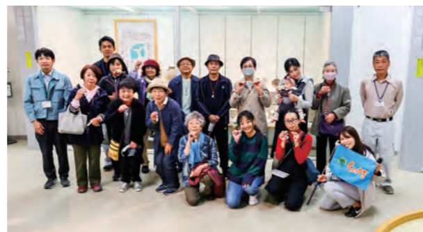
11月に実施した市政バスツアー（弥生のムラ）