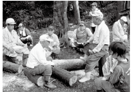
▲国東町赤松区での応援活動

このような集落を、企業やNPO、ボランティア団体など様々な活動団体の協力をいただいて応援していき、平成21年度から県と市町村で協力して始めた事業です。