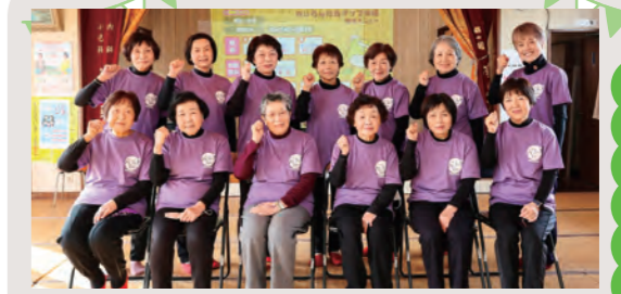
池ノ内区元気かいの皆さん (武蔵町池ノ内)