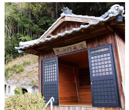
毘沙門天様を祀っているお堂

野仏、国東塔、お地蔵さんなど、地域の人々が大切にしているものもたくさんあるよ。みんなの周りにはどんな文化財があるかな？