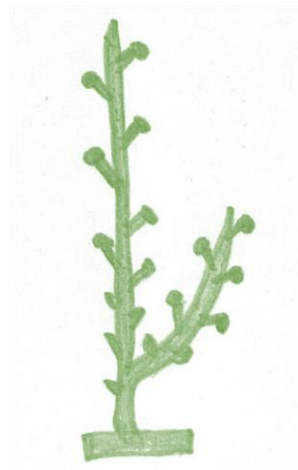
残した枝によく日が当たり 花芽も多く付く