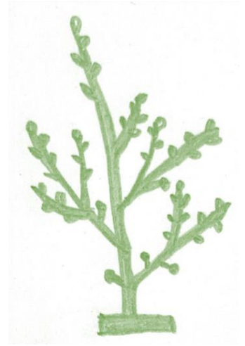
伸ばしたい方向にある芽のすぐ上を 切るのが基本だが、ブドウやラズベ リーなど枝が柔らかい品種は芽と芽 の中間を切る