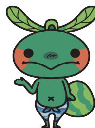
国東市マスコットキャラクター 「さ吉くん」