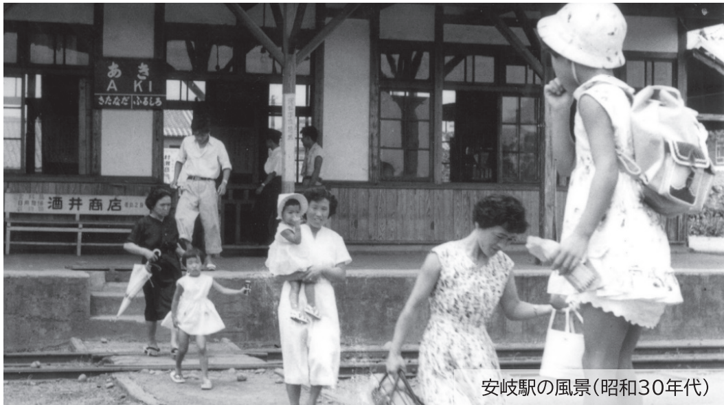
安岐駅の風景(昭和30年代)

国東鉄道は、大正から昭和41年の廃線まで長らく市民の公共交通機関として親しまれてきました。そして、昨年の令和4年(2022)には、大正11年(1922)の国東線開業から100周年を迎えました。本展では、国東鉄道に関する収蔵資料や当時の写真などを展示し、かつて国東の地を走っていた国東鉄道について紹介します。