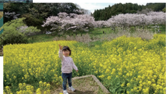
▲ 安岐ダム桜まつりに行きました！