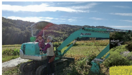
▲ ショベルカーに大興奮の娘（とばあば）