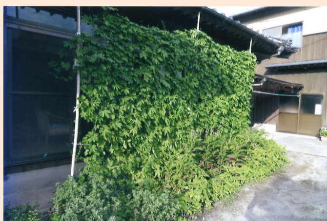
令和4年度 家庭部門賞 原 昌宏 様