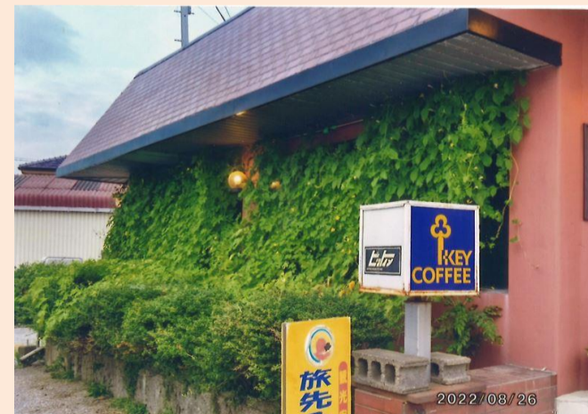
令和4年度 事業所部門賞 コーヒーハウス ピットイン 様