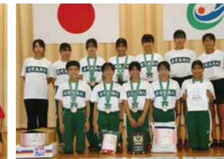
3位 鹿児島高等学校 1時間12分12秒