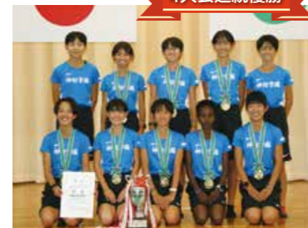
1位 神村学園高等部(鹿児島) 1時間9分15秒