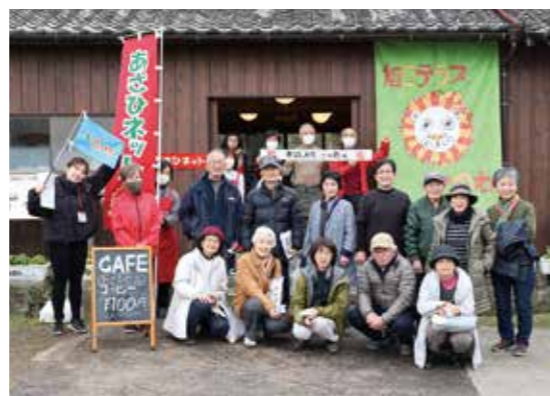
令和5年7月に実施したバスツアー