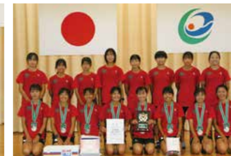
2位 宮崎県立小林高等学校 1時間11分27秒