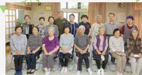
塩屋第二区週一元気アップ体操教室 (安岐町塩屋)