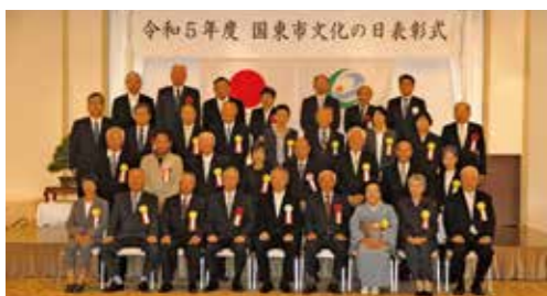
令和5年度 国東市文化の日表彰式