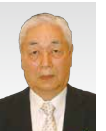
公益財団法人 大分県交通安全協会 国東支部 西武蔵分会

民生委員・児童委員として、平成13年12月1日から令和4年11月30日までの21年間活動され、地域社会の福祉の増進に貢献されました。