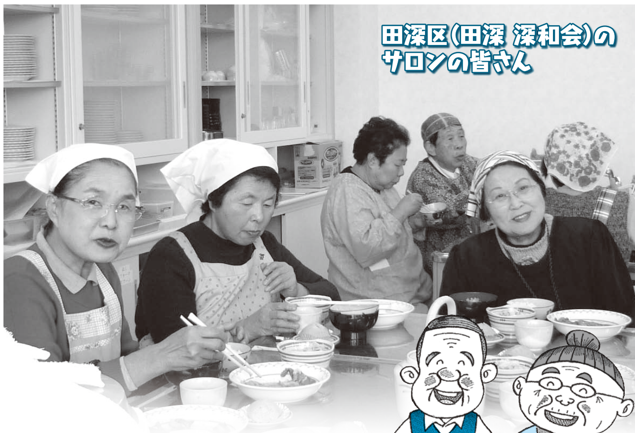
▲栄養改善のための料理教室