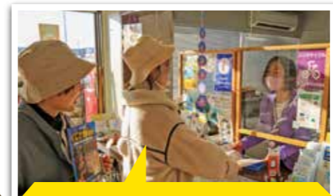
「宝発見のキーワード」を報告し、アンケートに答えて調査終了だ!

「宝発見のキーワード」が正しければ豪華賞品が当たる抽選に応募できるよ!! ※抽選の応募にはアンケートの回答が必要となります。