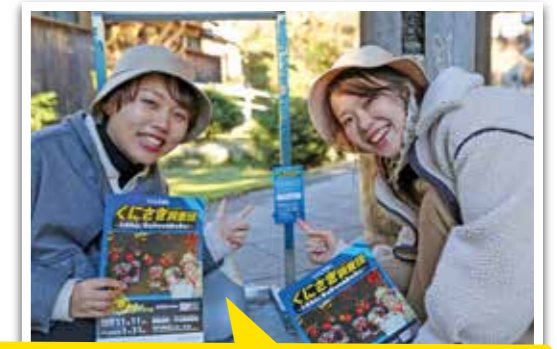
入手した3つの手がかりをつなげて最後の謎を解くと宝箱のありがた分かるぞ!

手がかりが見つかった!宝の地図にメモをして、あと2つの手がかりを求めて調査を継続だ!