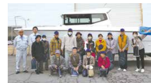
令和5年12月に実施したバスツアー