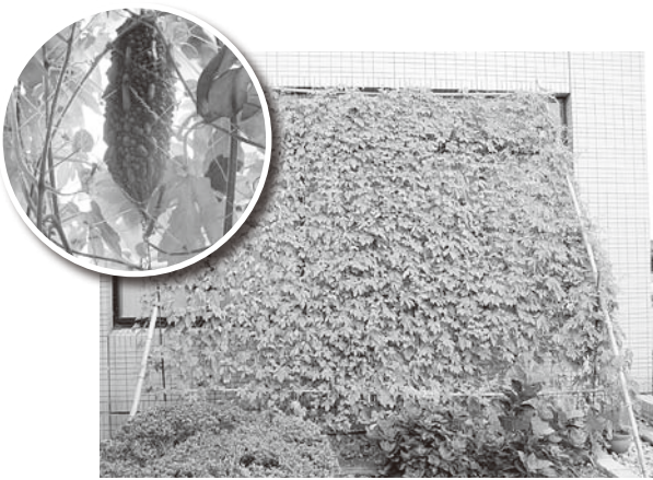
▲みどりのカーテン

国東市では、家庭で取り組む地球温暖化対策として、市民の皆さんにご協力をいただき、取り組みの拡大の案内役を担う「くじやきエコ・サポーター」を募集します。環境保全活動は一人ひとりの努力が大きな成果につながり、ご家庭で手軽にできる取り組みです。多くの方のご応募をお待ちしております。