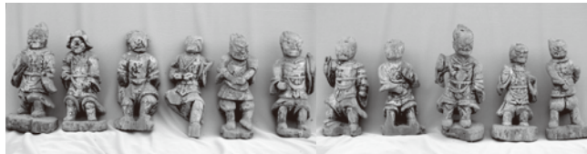
木造薬師如来坐像及び十二神将立像