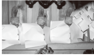
木造六所権現男神像 (6軀)