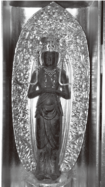
銅造観音菩薩立像 (1躯)