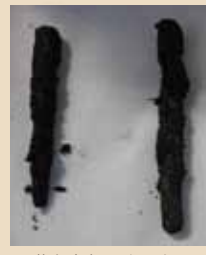
△塔身内部にあったノミ

り、国東市を代表する宝塔です。 この宝塔の石材表面全体は経年による風化が進み、苔などが付着して傷みが著しいことから、今年1月から宝塔の解体修理を行っています。 解体作業中、塔身内部に2本の鉄製のノミが納入されていることがわかりました。このノミで宝塔を造作したと思われる強化作業、撥水剤の塗布、組立作業が予定されています。 今回、岩戸寺の協力により、この解体修理中の国東塔の一般公開を行います。解体した国東塔の姿を見学することができます。ぜひご覧ください。