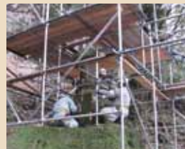
①足場を組み解体作業開始