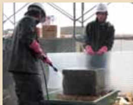
④水で苔や汚れを除去